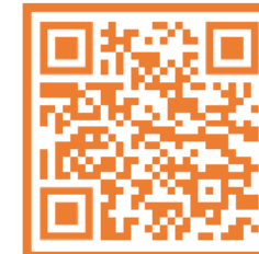
Tableau complet des activités régulières ADAS Saclay